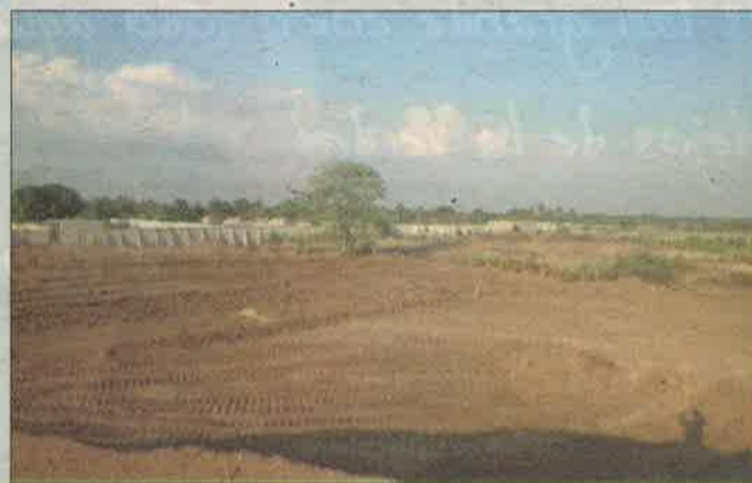
En estos terrenos se ha empezado a construir la escuela.

Tres años de estudio preceden a este proyecto y una visita de una delegación de la fundación en abril de 2012 al país, donde se cerraron múltiples detalles para la edificación del complejo.